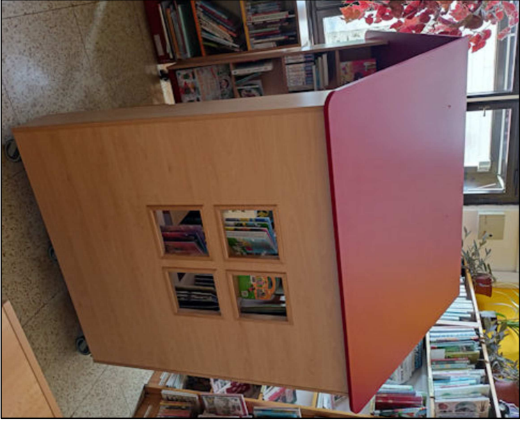
SNÍMEK SOUČASNÉHO STAVU DOMEČKU